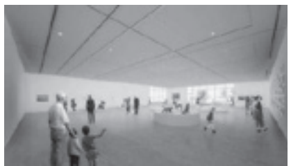
提供：横総合計画事務所 イメージ制作：ヴィックVicc Ltd.