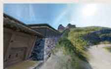
●画面サンプル(登り石垣)