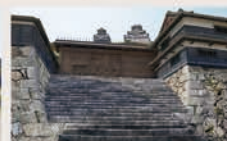
●画面サンプル(枡形)