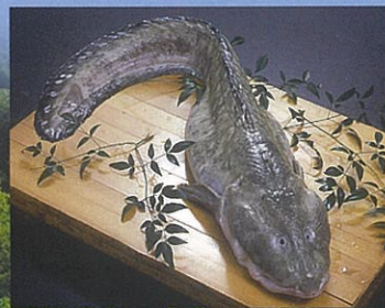
ばばちゃん (タナカゲンゲ)

鳥取の冬の味覚の王者でジオの恵み。漁獲量日本一の産地だからこそ食べられる「かに刺し」は絶品です。