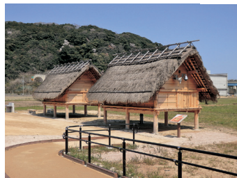
青谷かみじち史跡公園 (イメージ)