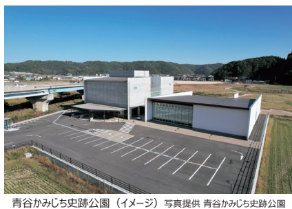
青谷かみじち史跡公園 (イメージ)