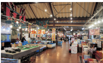
かるいち (イメージ)