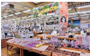
わたたいな (イメージ)