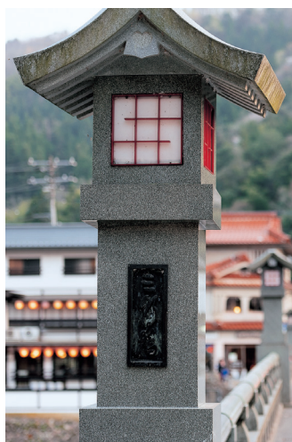
三朝温泉 三朝橋 (イメージ)

※左は投入堂の写真ですが、選拝所や双眼鏡からの眺めではなく近距離の別アングルで撮影した写真です。