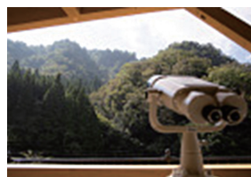
投入堂選拝所 備え付け双眼鏡 (イメージ)