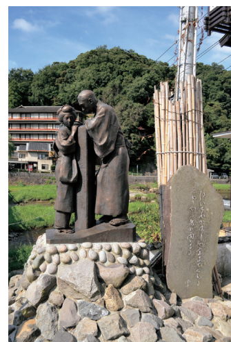
映画「三朝小唄」の像 (イメージ)