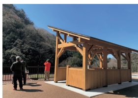
投入堂選拝所 (イメージ)