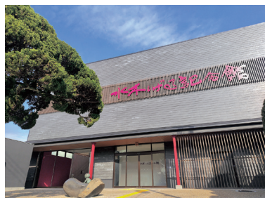
水木しげる記念館（イメージ）