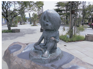
水木しげるロード（イメージ）