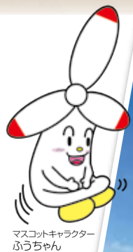
マスコットキャラクター ふうちゃん