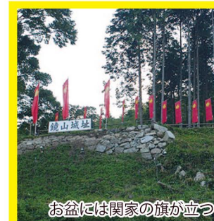
お盆には関家の旗が立つ

関ヶ原の功により1610年、関一政が日野・会見・汗入のうちの五万石で当地に転封となり築城。同時に、アシなどの茂るこの地に城下町をつくりました。その後池田領となるも、一国一城令により城は廃され陣屋となり、1869年より郡政所に転用されました。現在も、城址の石垣や井戸などが残っています。(黒坂駅から600m) ※ガイド要予約