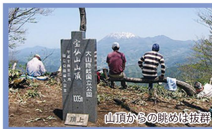
山頂からの眺めは抜群

日野川の上流を6人乗りのラフト(ゴムボート)で豪快に下ります。スリルとスピード感を味わいながら、自然のすばらしさを満喫できます。(4、5、10月の土日祝日のみ開催) ※要予約(日野町教育委員会 ☎ 0859-72-2107)