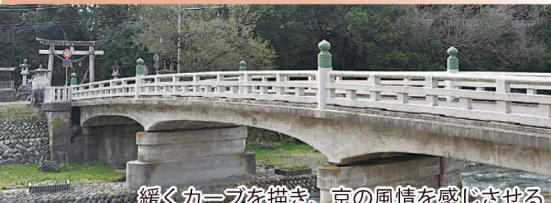
緩くカーブを描き、京の風情を感じさせる

祇園の森に立つ祇園神社(根雨神社)の鳥居へ続くこの橋は、昭和8年建築。鉄筋コンクリート製ながら、高欄の擬宝珠が景観との調和を見せます。(根雨駅から400m)