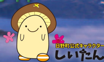
日野町公式キャラクター しいたん

〒689-4503 鳥取県日野郡日野町根雨101 日野町役場 産業振興課 ☎ 0859-72-2101 FAX 0859-72-1484 日野町 HP http://www.town.hino.tottori.jp E-mail kankou@town.hino.tottori.jp 2020年3月発行 印刷:株式会社 高下印刷