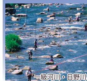
一級河川・日野川

日野川は、西日本有数のアユ釣りスポット。6月のアユ釣りの解禁には太公望が訪れます。