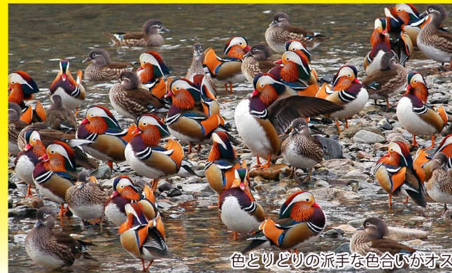
色とりどりの派手な色合いがオス

越冬のため、秋から春先にかけて日野川に飛来。根雨のオシドリ観察小屋(11月~3月)からは、ピーク時約1,000羽の姿を間近に観察できます。観察のおすすめは早朝または夕方。仲睦まじく美しいオシドリは、鳥取県の鳥、日野町の鳥にも指定されています。(根雨駅から400m)