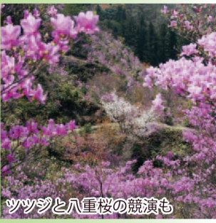
ツツジと八重桜の競演も

春の桜・ツツジの名所として有名な公園です。特に、4月中・下旬に開花する約3万本のミツバツツジは、山全体をピンク色に染め、近隣にその類を見ない素晴らしさです。夏の谷川の涼、秋の紅葉と四季を通じて楽しめます。公園内にある滝山神社の境内には、高さ50mの龍王滝があり、小泉八雲著「骨董」の中の「幽霊滝の伝説」の舞台としても有名です。(黒坂駅から2km)