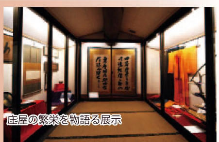
庄屋の繁栄を物語る展示

庄屋の米蔵を改造した美術館。1階は絵画展示、2階は江戸・明治の古美術館です。伊藤博文・東郷平八郎・山岡鉄舟の書、古刀などが楽しめます。(上菅駅から1km) ☎ 0859-74-0136