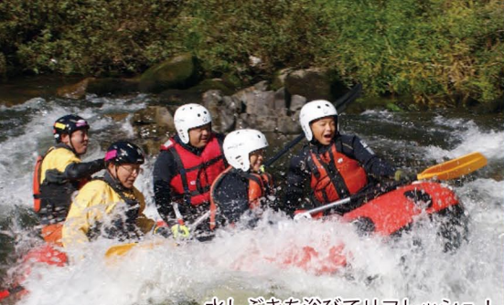
水しぶきを浴びてリフレッシュ!