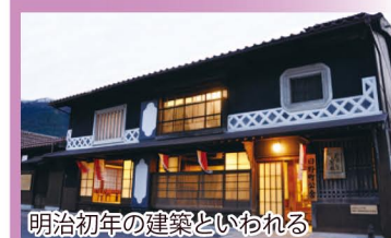
明治初年の建築といわれる

かつて、たたら製鉄でできた鉄を商っていた「出店近藤」(現日野町公舎)内にあり、たたら製鉄に関する展示を行っています。※春から秋の土日開校(根雨駅から400m)