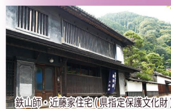
鉄山師・近藤家住宅(県指定保護文化財)

日野町根雨を通る出雲街道は、かつて松江藩の殿様が参勤交代をする重要なルートでした。本陣の門など、根雨の町並みは宿場町の風情を今に残しています。(根雨駅下車すぐ)