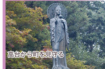
高台から町を見守る

根雨の町並みと遠く大山の南壁が一望できる公園で、春は桜の名所として親しまれています。現代彫刻界の異才と称される辻晋堂作の平和観音像が建立されています。(根雨駅から700m)