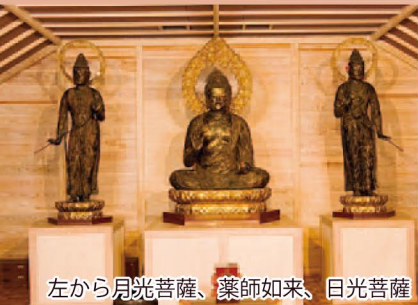
左から月光菩薩、薬師如来、日光菩薩

日野川中流のカヌーの里は、カヌースラロームの適地。ゆったりと流れる淵や岩が覗く急流など、スリルに富んだコースは西日本屈指のコースとして知られ、毎年大会も開かれています。また選手たちの練習の場として活用されています。 ※利用は要予約(町教育委員会: ☎ 0859-72-2107)