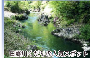
日野川くだりの人気スポット

日野川の峡谷が一層せまり、奇勝景観を展開。5月中旬にはキシツツジが岸辺に群生し、岩肌をピンクに染めるのも見ものです。(黒坂駅から約2km)