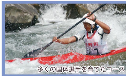
多くの国体選手を育てたコース

中国地方の百名山のひとつ、宝仏山(標高1,005m)。平成14年に大山隠岐国立公園に編入され、現在は登山道が整備されています。登山道入口から山頂までは標高差800m、登りは2時間余りかかります。山頂からは大山や美保湾が一望できます。※山開きは4月29日。(登山道入口まで根雨駅から400m)