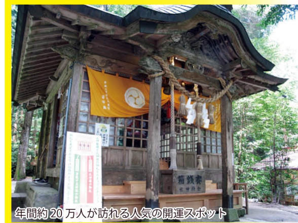
年間約20万人が訪れる人気の開運スポット

全国で唯一の縁起の良い名前の神社です。神社のある金持郷は、伯耆国守護職 金持広親の郷で全国「金持」姓のルーツです。1333年、金持景藤公は後醍醐天皇を奉じて討幕の軍に参画し活躍したと伝えられています。現在では、そのおめでたい名前にあやかり、金運・開運を求めて多くの参拝客で賑わっています。(根雨駅から4km) ■日野町観光物産館 金持神社 札所(売店) ☎ 0859-72-0481