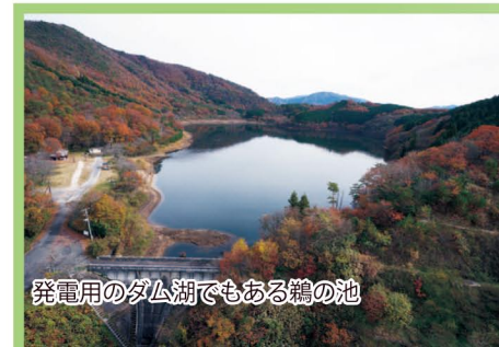
発電用のダム湖でもある鶺鴒の池

標高400mの高原にある周囲2.3kmの静かな湖「鶺鴒の池」。キャンプ場もあり、恒例の「鶺鴒の池マラソン大会」も開かれるほか、ハイキングや散策など、四季の楽しみ方もいろいろです。(根雨駅から7.0km)