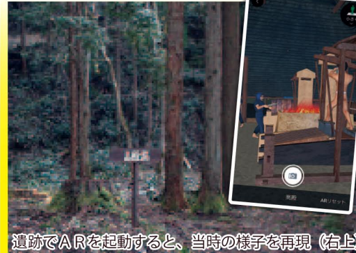
遺跡でARを起動すると、当時の様子を再現(右上)

根雨の鉄山師・近藤家が明治時代に経営していた「たたら製鉄」の跡。たたら研究の第一人者・俵国一による、操業時の詳細な記録が残っており、学術的にも貴重なたたら遺跡です。スマホやタブレット端末に専用アプリ「たたらバーチャルガイド」をダウンロード( https://okuhino-tatarano.com )すれば、操業時の様子が画面上に再現されるAR体験も。(上菅駅から徒歩約3km)