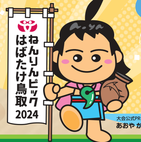
大会公式PRキャラクター あやかみじろう