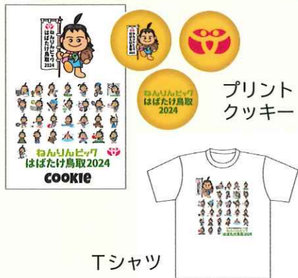
プリント クッキー