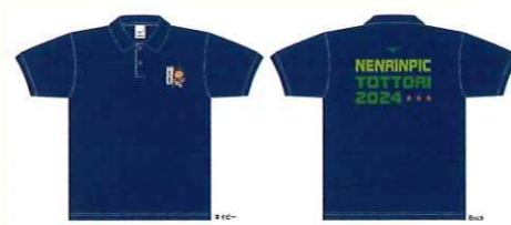
(表) ポロシャツ (裏)